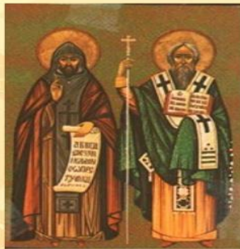
Св. Св. Кирил и Методий

Св. св. Кирил и Методий, известни още като Солунските братя, са създатели и разпространители на първата славянска азбука. Канонизирани като светци за превода и популяризирането на Библията на старославянски език.